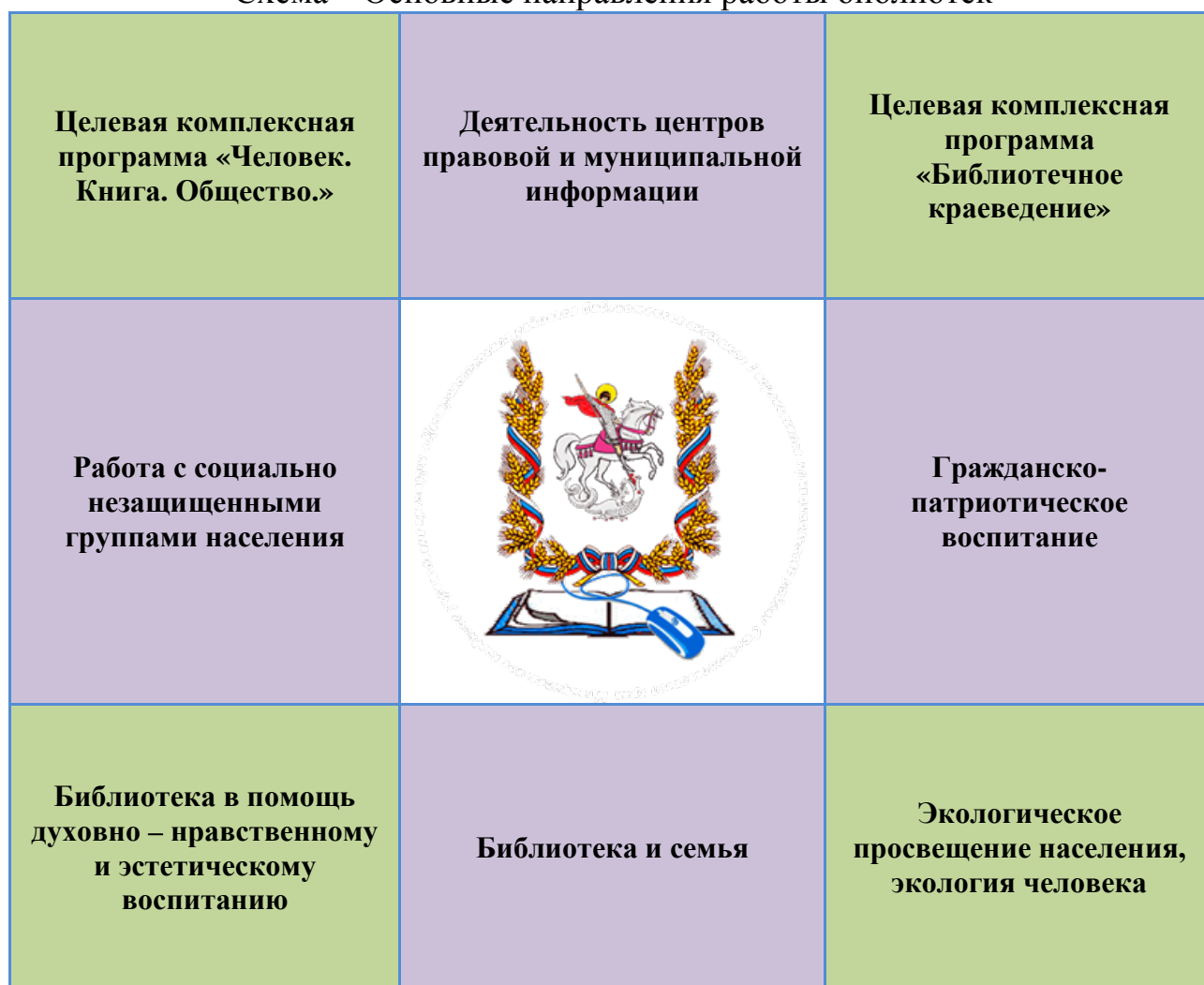
Схема – Основные направления работы библиотек

План культурно-просветительных мероприятий МКУК «МЦБС ГГО» приведен в приложении.