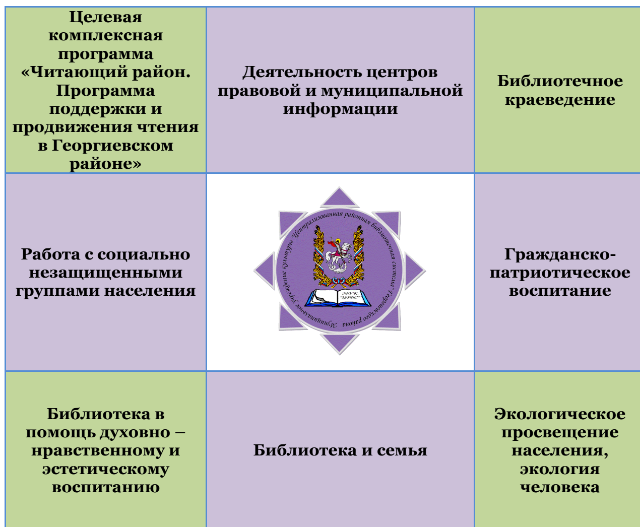
Схема – Основные направления работы библиотек

Полный план мероприятий МКУК ЦРБС по основным направлениям приведен в приложении 2.