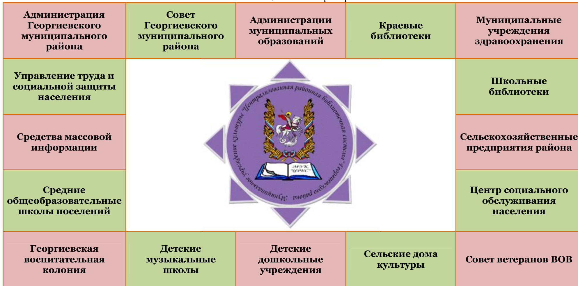
Схема – Социальное партнерство