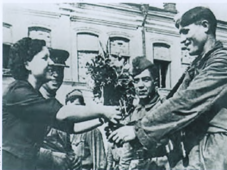
КОГДА В 1943 ГОДУ ОСВОБОДИЛИ ОРЕЛ, БРЯНЦЕВ ВОШЕЛ В НЕГО ВМЕСТЕ С ДРУИМИ ПАРТИЗАНАМИ